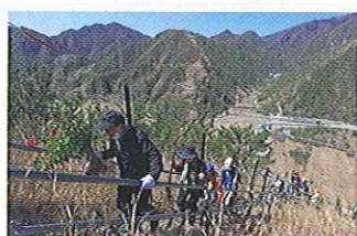
A 約750~900段の工事用階段を登った高所に植樹します。