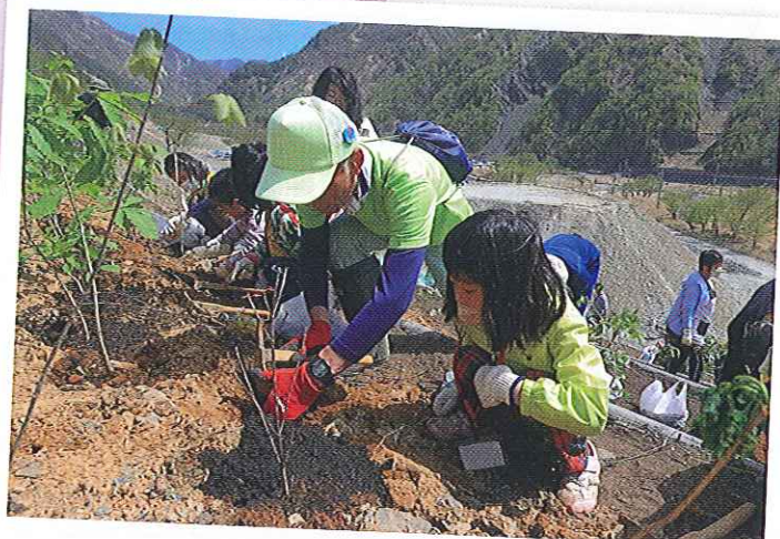
B ゾーン 栃木県管理地

駐車場の近くの久蔵口植樹地。道沿いの山の斜面に植樹します。小学校などの体験植樹が行われている場所です。