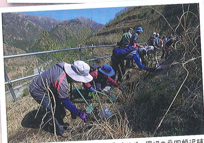
A ゾーン 国土交通省管理地

足尾砂防ダム周辺の戸四郎沢植樹地。高所にあります。植樹地には黒土が入っています。