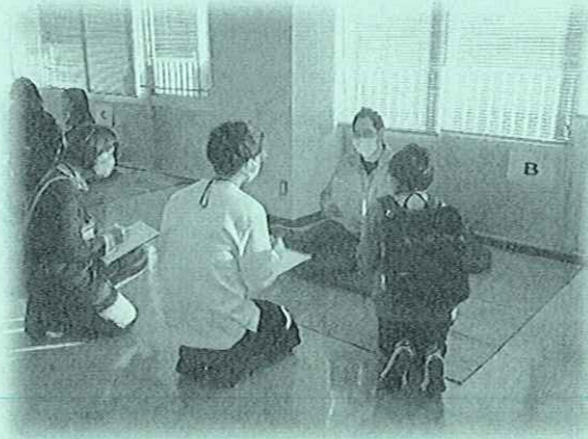
避難所巡回体験の様子