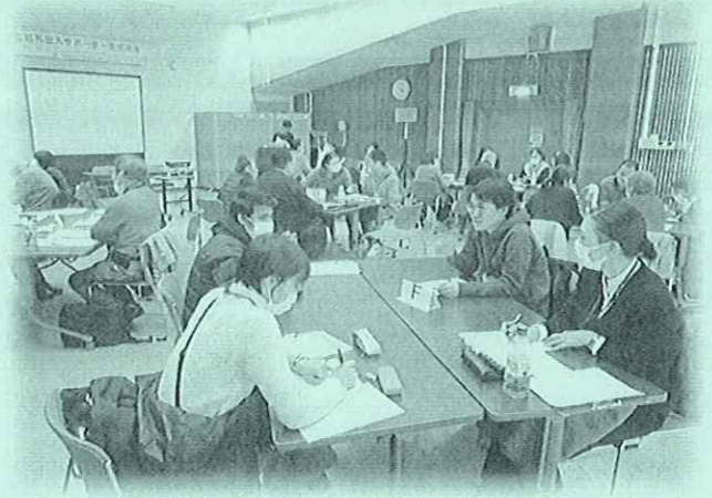
昨年度のサポーター養成講座